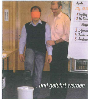
... und geführt werden